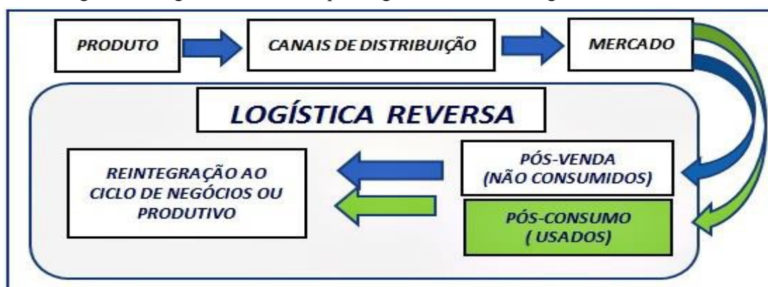
Figura 1 – Logística reversa. Esquema geral das áreas de logística reversa

A logística e a logística reversa fazem parte dos processos internos da empresa, ou seja, do microambiente interno, relacionando-se diretamente com o microambiente externo, constituindo-se em elo entre empresa de um lado e clientes e fornecedores de outro. Conforme figura 1, tem-se uma visão geral do inter-relacionamento entre os microambientes: