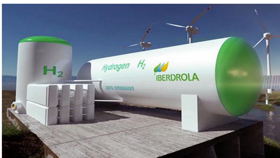
Figura 3 – Ilustração de um tanque de ar comprimido.

No entanto, esse tipo de armazenamento também gera perdas energéticas no processo produtivo de cerca de 11% a 13% devido a pressurização (Abe et al , 2019). Para contornar esse problema, sugere-se o armazenamento em dutos subterrâneos, por ser uma opção mais viável a longo prazo e larga escala, contudo, há também um meio já utilizado pelas petroquímicas há mais de 50 anos, as cavernas de sal, que possuem condições de armazenar melhor esses gases, considerando também os seus aspectos geológicos (International Energy Agency, 2021), vide Figura 3, a seguir..