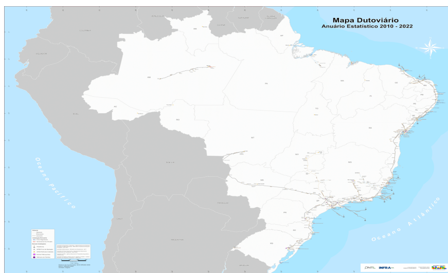
Figura 2 – Distribuição dutoviária no Brasil

No Brasil, as dutovias são o meio de transporte menos utilizado, correspondendo a cerca de 4% dos transportes realizados atualmente, se concentrando principalmente em vias na costa brasileira com pouco mais de 9.000 km de comprimento. O sistema dutoviário mais conhecido é o gasoduto Brasil-Bolívia, maior duto da América do Sul com mais de 3.000 km de extensão. (Vaz; Oliveira; Damasceno, 2005). Apesar disso, os oleodutos são os tipos mais utilizados no país, correspondendo a mais de 60% dos dutos brasileiros, sendo controlado quase que exclusivamente pela Transpetro, empresa do grupo Petrobrás, vide Figura 2, a seguir.